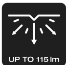
UP TO 115 lm

Měkké polstrování a přidavný nastavitelný popruh pro optimální pohodlí při nošení