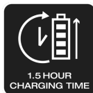
1.5 HOUR CHARGING TIME

Tři světelné funkce: až 115 lm (silné světlo), až 50 lm (úsporné světlo) a funkce červeného blikání na zadní straně.