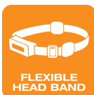
FLEXIBLE HEAD BAND